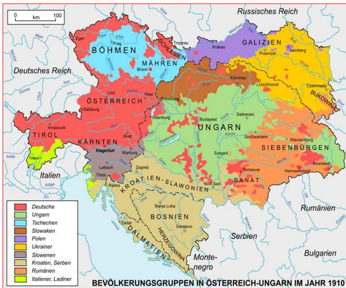
Mapo de lingvoj en Aŭstrio-Hungario

Sed ĝi estis politike (kaj milite) malforta, pro tiu multlingveco. Kiam la soldatoj ne komprenas ordonojn de la militestroj, kaj ne kapablas raporti al ili, malfacila estas venko. Kiam homoj de iu regiono ne komprenas paroladojn de politikistoj de alia regiono, nebla estas demokratio je la tutlanda nivelo.